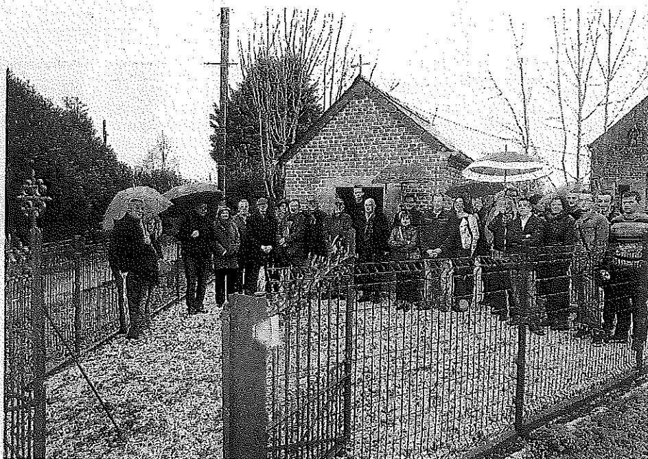
Rue du Sart, la chapelle a retrouvé une seconde jeunesse.